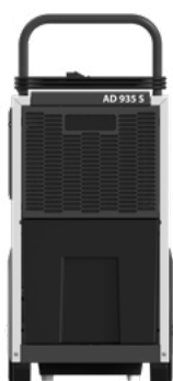
AD 935 S